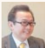
サンキョードラッグ 代表取締役社長 平野 健二 著